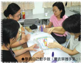
◆學員自己動手做「薰衣草護手乳」

為了活動內容能辦得更好，我們做了簡單的問卷調查，學員普遍認為從中吸收不少知識。不僅學習如何輕鬆取得材料、如何在家就能DIY做出乾洗手及護手乳，同時也認識許多香草植物的特性及日常生活的應用實例。