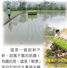
這是一個說新不新、說舊不舊的話題！有趣的是：這張「穀粟」來自於稻作生產與米糧