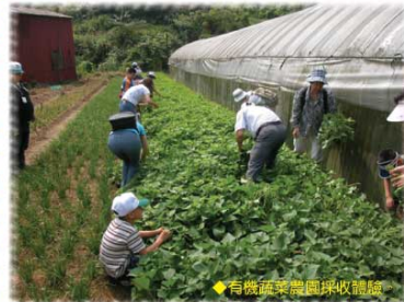
◆有機蔬菜農場採收體驗

由本會與木柵農會合作辦理的「木柵農村風情逍遙遊」活動已於七月二十三日、二十四日完成二梯次的活動行程，計有61位朋友共同參與。