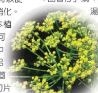
◆佛羅倫斯茴香花序特寫。

茴香開花時植株高度可達一公尺以上，纖細絲狀般的羽狀複葉搭配上鮮黃色小花，也是很討人喜歡的庭園植物和插花材料。開花後結的種子一般稱作茴香子或小茴香，是常用的香料，但現在市場上常把孜然芹 (Cumin) 誤稱為小茴香，其實孜然是維吾爾人烤羊肉不可或缺的另一種香料，兩者不可混為一談。