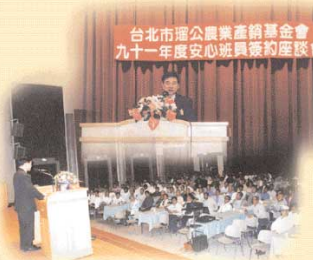
● 本會董事長親自主持簽約座談會。

本會年度的「安心蔬果產銷班」簽約活動，已於九十年十二月三日上午假台北市劍潭海外青年活動中心經國紀念大禮堂順利召開完成。與會的來賓包括士林區農會、木柵區農會、蘆洲市農會、三芝鄉農會、瑞芳地區農會、彰化埔心農會等農事指導員及來自全省的安心班員及班員代表等共計272人，出席相當踴躍，活動為時兩個半鐘圓滿結束。