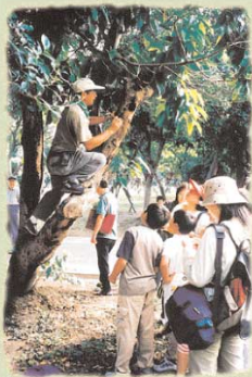
● 到大安公園與自然交交朋友。

穿越台北市區的大安森林公園，除了人來人往之外，您曾否停下腳步，回神欣賞一下兩旁的青翠綠葉、蟲鳴鳥叫或是滿地的野花？大自然所蘊含的無限生機，往往是現代忙碌的人們所隨處遺忘的對象。然而，「有機生活美學」就從這裡為您揭開生活有機的引子。