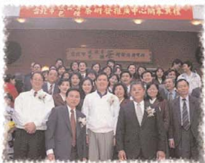
台北市市長 馬英九謹識九月一日

台北市瑞公農產銷基金會成立以來，在歷任董事長、董事、監察人、顧問以及工作人員共同努力耕耘下，廣受各界好評。尤其是輔導產銷「安心」與「有機」蔬果上，提供國人健康的選擇。另外協助本府於八十九年元月開幕啓用「木柵鐵觀音、包種茶研發推廣中心」之經營與管理，並同時深受國內、外參觀人士的嘉許，功績卓著。今基金會一本初表，為擴大服務層面，已積極策劃完成「瑞公農產銷會訊」雙月刊之發行，希望藉此刊物能提供更多農產銷資訊，以達社會教育與宣導目的，提昇民衆對茶的認知與認識。本人謹代表台北市政府感謝瑞公農產銷基金會的用心與努力。誠祝出刊順利、會務成功。並祝讀者身體健康、萬事如意。